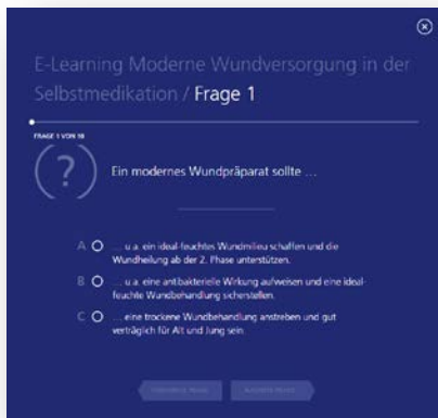
Durch einen interaktiven Fragen-Wizard werden die Teilnehmerinnen und Teilnehmer durch die Lernerfolgskontrolle begleitet.

Die E-Learning Module verfügen über eine einfache Benutzerführung, das Lerntempo bestimmt die PTA selbst, Kurse können unterbrochen und später fortgesetzt werden. Durch Grafiken, Bilder, Videos und teilweise Tonbeiträge wird der Lernstoff veranschaulicht. Alle PTAheute-E-Learnings sind von der Bundesapothekerkammer zertifiziert und mit jeweils einem Fortbildungspunkt akkreditiert, das heißt, wer 70 % der anschließenden Lernerfolgskontrolle korrekt beantwortet, erhält sein persönliches Fortbildungszertifikat, eingestellt als PDF in sein Fortbildungscockpit zum bequemen Download. Dass das neue E-Learning-Angebot bestens angenommen wird, zeigen nicht nur die hohen Nutzerzahlen, sondern auch die lange Verweildauer auf den Fortbildungsseiten. Im Durchschnitt beschäftigen sich die Teilnehmerinnen und Teilnehmer 45 Minuten mit einem Kurs und erhalten damit vertieftes Beratungs- und Produktwissen.