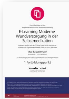
Teilnehmerinnen und Teilnehmer erhalten ein Zertifikat, wenn Sie mindestens 70% der Fragen zur Lernerfolgskontrolle richtig beantwortet haben.